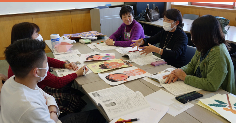
絵画・描画あそび

子どもたちの生活の中から様々な場面、姿の「動詞」を思い起こして並べてみると、トップは何とんでも「遊ぶ」ではないでしょうか。芸術と遊びフォーラムでは、今まで取り組んできた子どもの活動を全国の保育者や子どもに関わる各分野の方々が集まり考え合います。今回は「遊びの中で子どもを育む」がテーマです。新年度からも子どもと楽しんで行える活動のヒントをもらって活力をUPしましょう