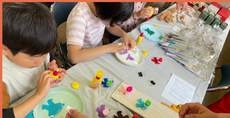
手づくりおもちゃ